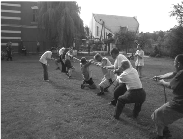
przeciąganie liny to najbardziej zacięta konkurencja