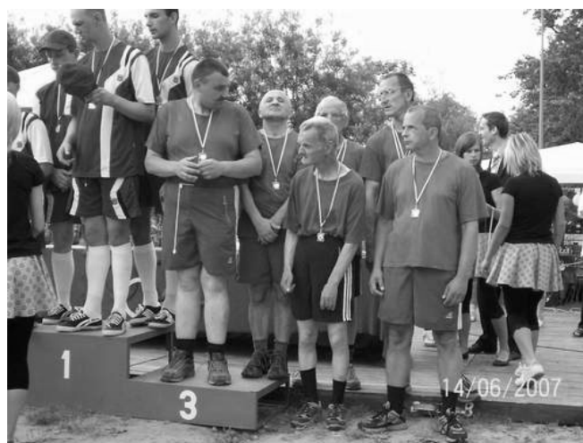
Nasza drużyna zajęła III miejsce