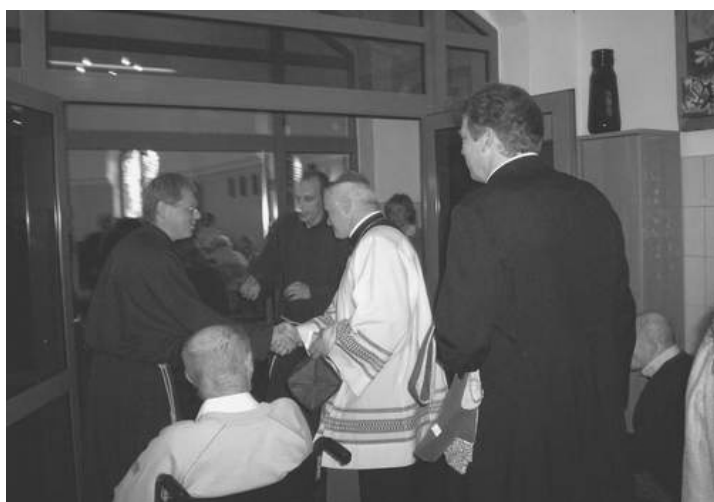
bracia Albertyni witają księdza biskupa