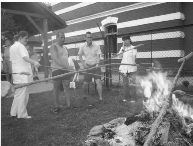
ognisko to nieodzowny element naszych imprez