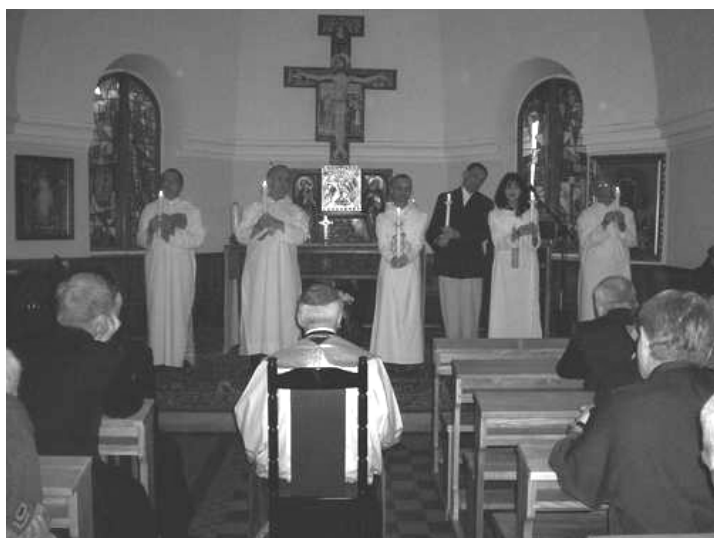
Prezentowanie „Nie można żyć bez światła” wzbudziło zaciekawienie wśród gości.