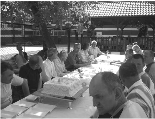
Solenizanci przed tortem